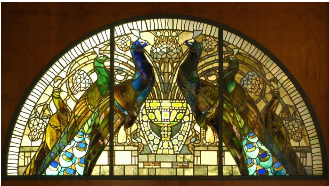
1. La Stanza dei Ciclamini, I Pavoni , Umberto Bottazzi, vetrata, 1912